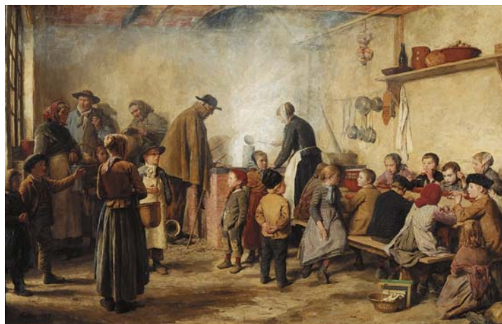
Albert Anker, La soupe populaire d'Anet, 1893